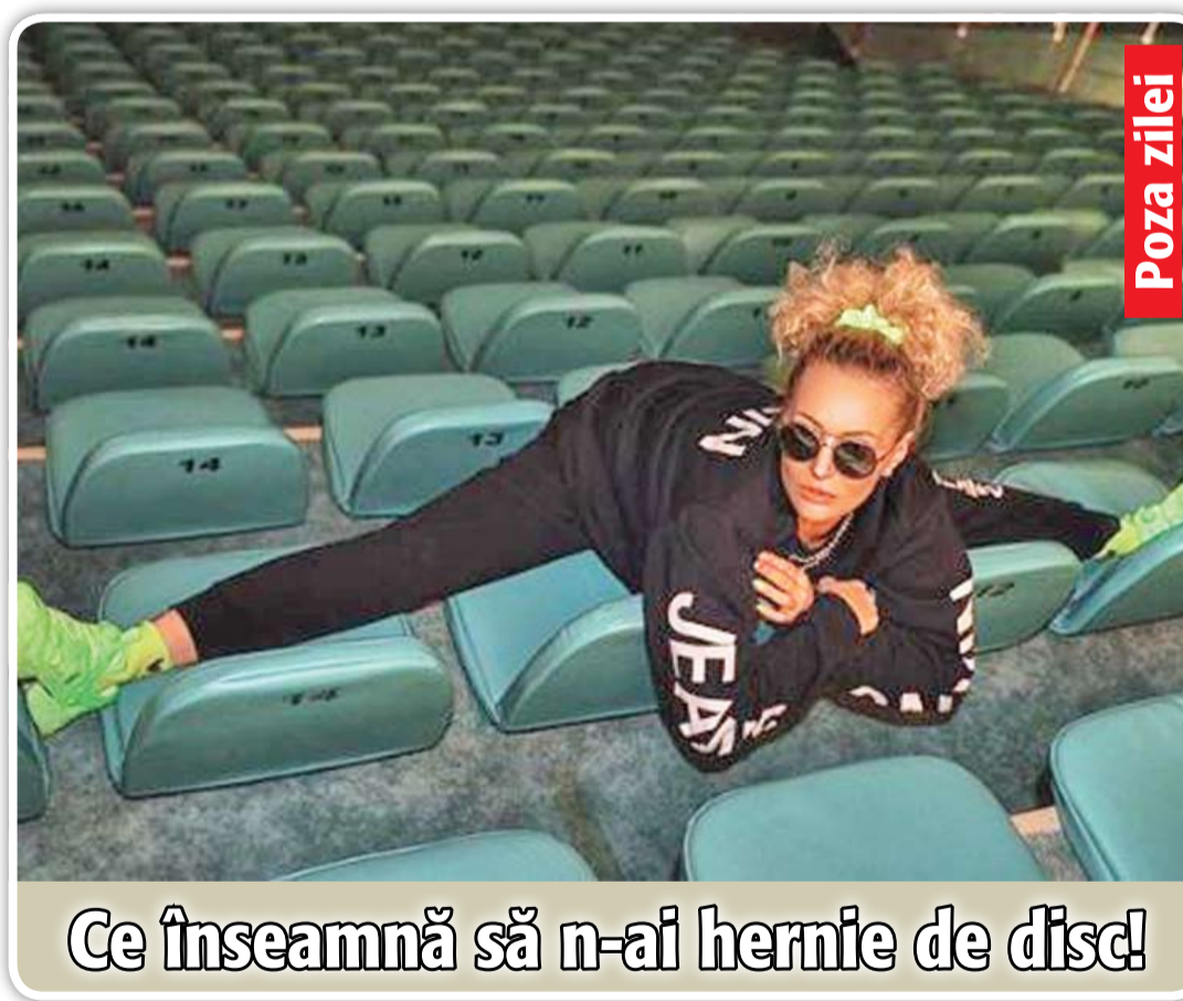
Ce înseamnă să n-ai hernie de disc! Poza zilei