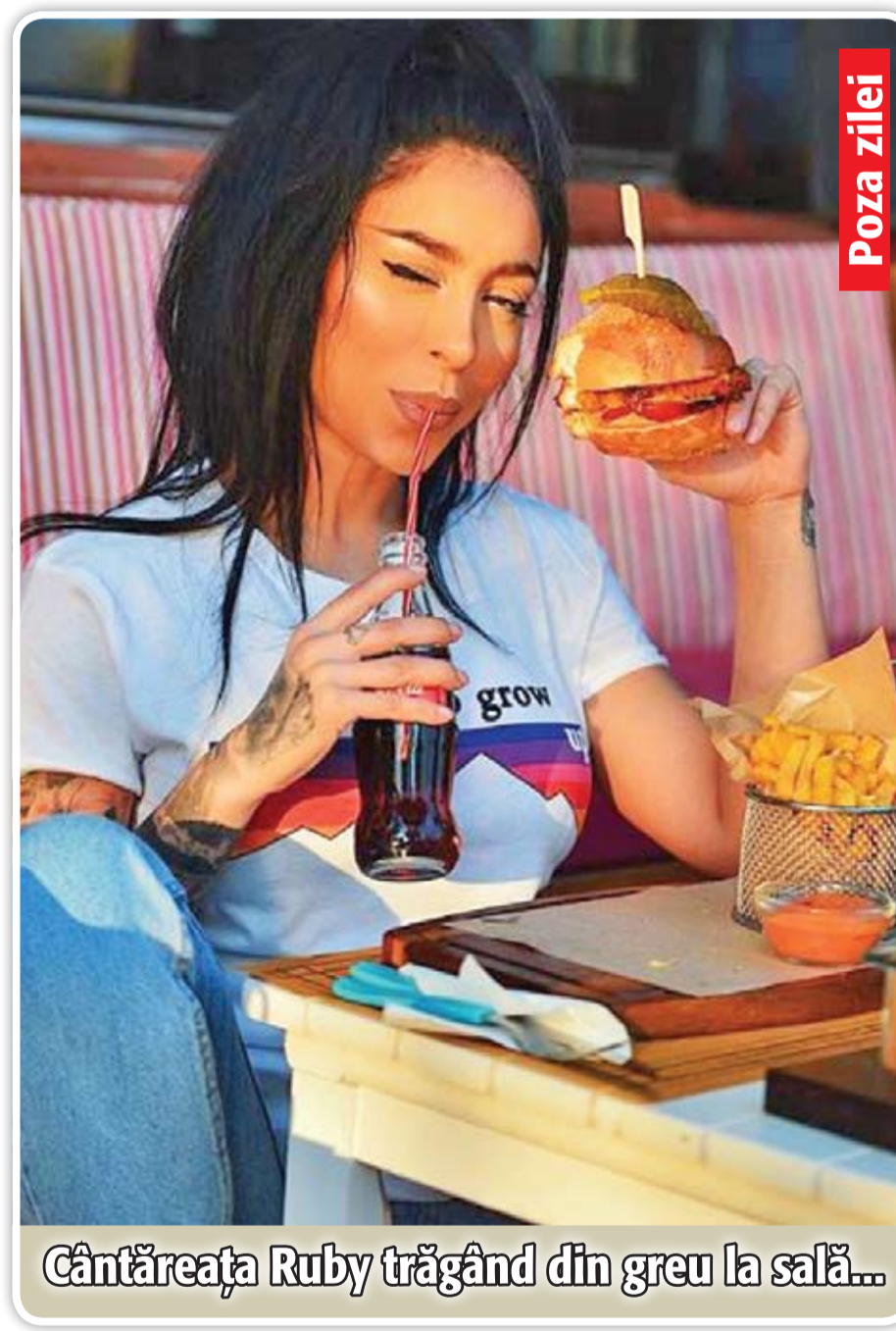
Cântăreața Ruby trăgând din greu la sală...