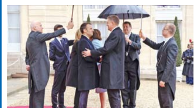
Figura de stil și figurantul Klaus

Aflat la Paris, Klaus Iohannis a scos pe gură cea mai răsuflată poantă. Fără sare și fără piper. Nu puteai sta serios pentru că nu aveai de ce. Dar nici să râzi nu puteai, pentru sașii nu au avut, în copilărie, bancuri cu Bulă și nu știu ce e umorul.