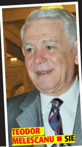
TEODOR MELEȘCANU ■ SIE